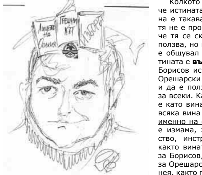
Пентагонът си поръчва политическите му романи. Но тук „такова животинство“... — Не, няма!

Никога не е стока, не я продадем или подменим! Така че, тя не става за пазара, който днес командва цялото общество! Защото пазарът е стока и пари! А истината си остава инструмент, начин на проверка, тя — колкото е страх, толкова — и дързост! Следователно, истината може да се сравни само с уличицата, която е израз на човешките отношения, както в обществото, така и в политиката. — Да! Защото всеки я ползва! Но за разлика от истината, тя се продава, разменя и откуп много си прилича — уличицата... с парите.