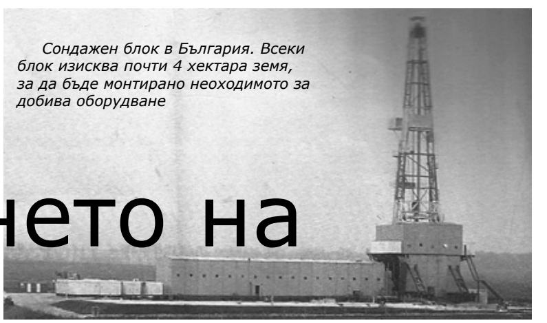
Сондажен блок в България. Всеки блок изисква почти 4 хектара земя, за да бъде монтирано необходимото за добива оборудване