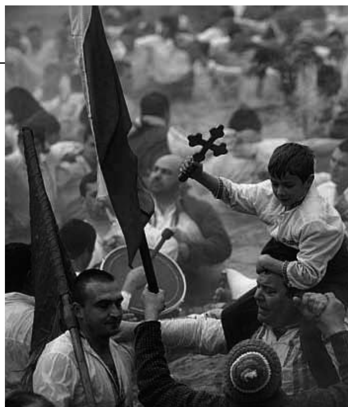
Народният обичай „Вадене на кръста“